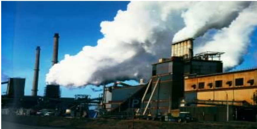
... and air pollution