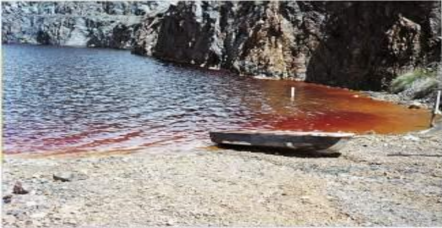
Polluted water ...