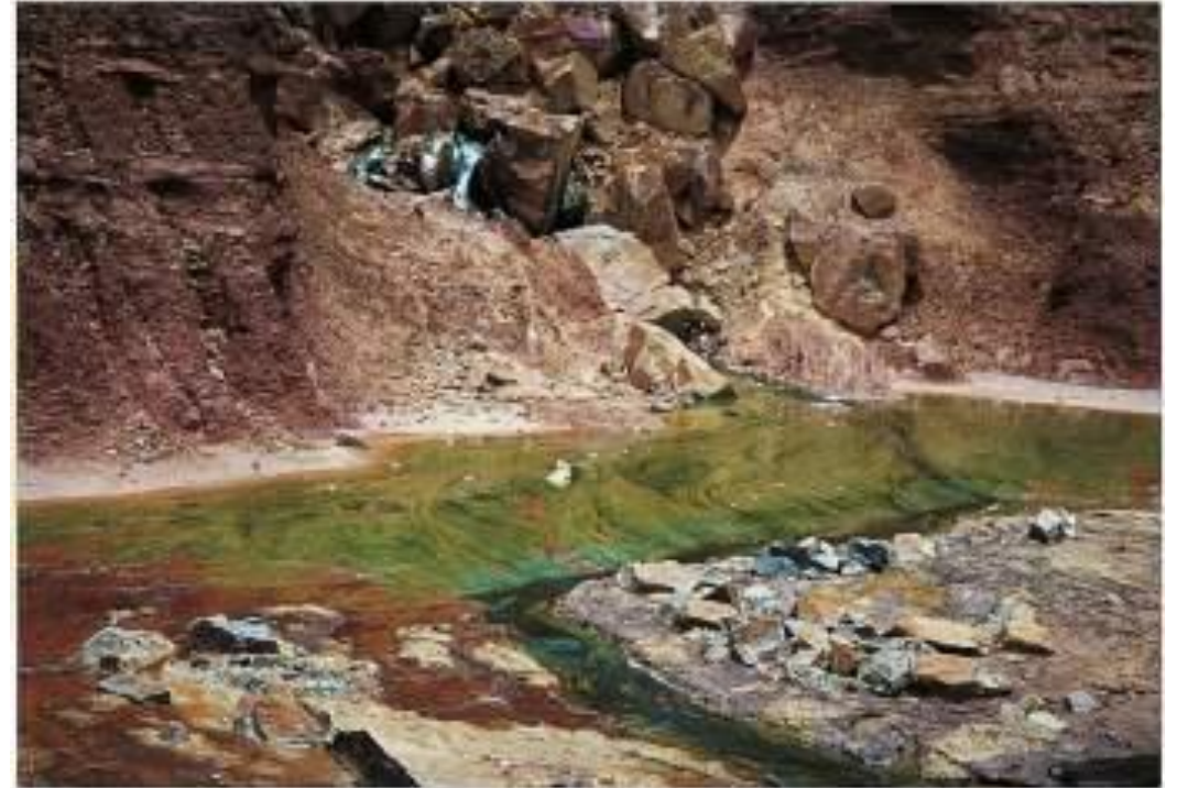
... by industrial discharge