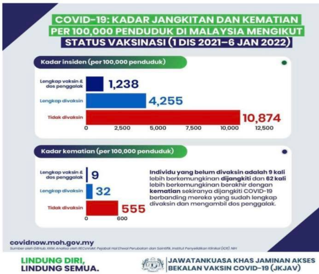
Rajah 1: Kadar jangkitan dan kematian per 100,000 penduduk mengikut status vaksinasi.