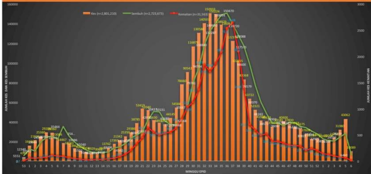
CPRC Kebangsaan KKM